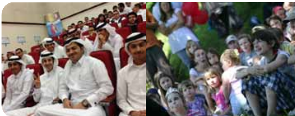
Die Zielgruppe: Zuhörer in Katar und beim Erzählfestival in Ogulin, Kroatien

Alle öffentlichen Erzähltermine sowie CDs und Bilder-Bücher: geschichtenerzaehlerin.de