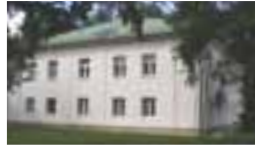
Mohr-Villa Situlistr. 73 – 75, 80939 München www.mohr-villa.de