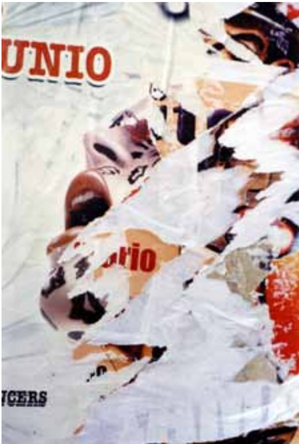
„Shout“, Fotografie, aufgenommen in Barcelona/Spainien, 2005, 28,0 x 35,5 cm, Print auf Aluminium, Auflage von 5 (Titelseite des Buches „Plakatief“, erschienen Feb. 2011, siehe Seite 16)

Tausende von Menschen betrachten sie tagtäglich, haben sie aber nie wirklich gesehen.