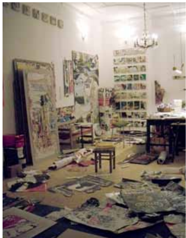
Atelier in Berlin, Anfang 2010