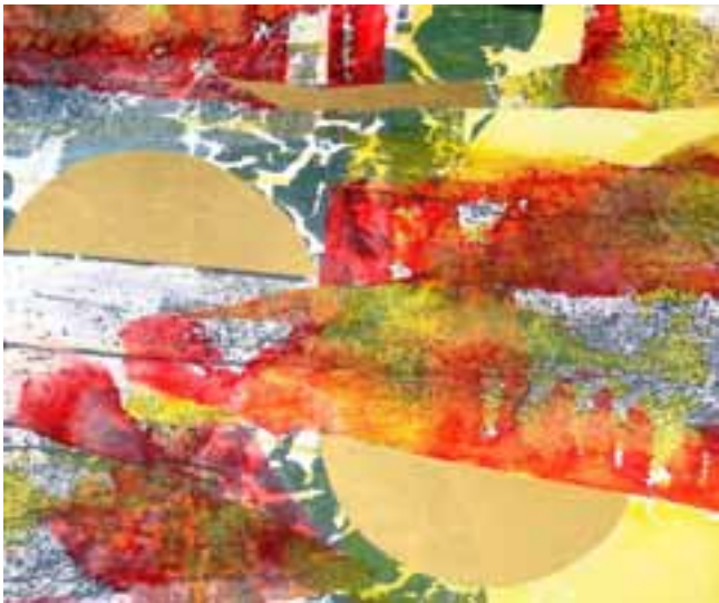
„Golden Globe“ – 50 x 60 cm, Malerei mit Papier auf Leinwand

Auf die Frage, welcher Künstler sie nachhaltig beeinflusst habe, nennt die Planeggerin den Nachkriegsabstrakten, mehrfachen Documenta-Teilnehmer und Gründer der Künstlergruppe Zen49, Fritz Winter. Auch er hatte das Bild als eigenständiges Gefüge betrachtet und nicht auf eine strenge Formensprache, sondern vielmehr auf Farbwerte und Komposition gesetzt.