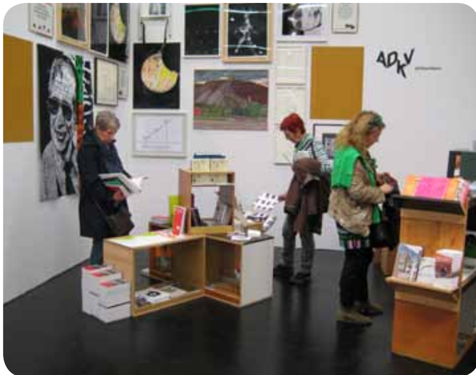
Messestand der ADKV auf der „ART COLOGNE 2014“

Die Kunstvereine können auf eine rund 200-jährige Geschichte zurückblicken. Sie wurden im Zeitraum zwischen ca. 1800 und 1840 vom aufstrebenden Bürgertum und von Künstlern selbst gegründet. Ihr Ziel war die Vermittlung zwischen Laien und der Gegenwartskunst und nicht zuletzt der Verkauf aktueller Kunstwerke. Die Beschäftigung mit Kultur und das Sammeln von Kunst sollte nicht länger dem Adel überlassen bleiben. Vereine, so auch die Kunstvereine, waren Ausdruck