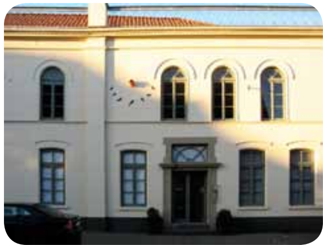
Kunstverein Graftschaft Bentheim mit eigenem Haus

Besonders sei hier die Kooperation zwischen der ADKV und