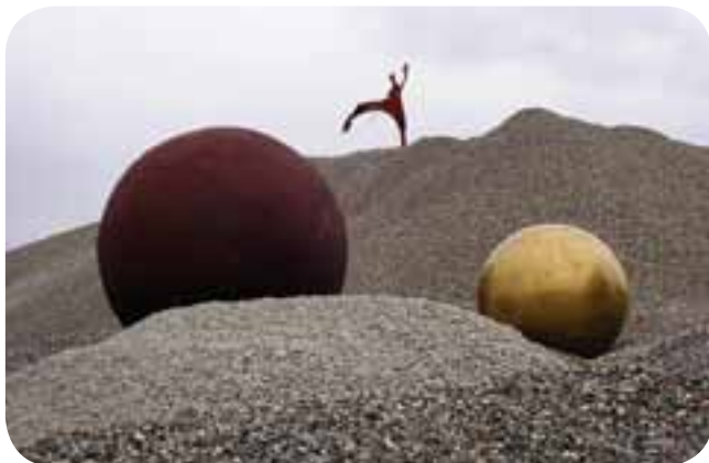
Ausstellungsmöglichkeiten und -chancen auch ohne eigenes Haus – „Kunst im Kies“, Kunstkreis Gräfelting e.V., 2011, Foto: Kunstkreis Gräfelting e.V.

Die ADKV versteht sich als Mittlerin zwischen Kunst, Politik, Medien und der von bürgerschaftlichem Engagement getragenen Institution „Kunstverein“. Sie unterstreicht mit ihrer Arbeit die große kulturpolitische Bedeutung der Kunstvereine. Der ADKV sind heute rund 300 Kunstvereine mit über 150.000 Mitgliedern angeschlossen – eine einmalige Situation weltweit.