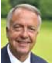
Bernd Neumann, MdB Staatsminister bei der Bundeskanzlerin Der Beauftragte der Bundesregierung für Kultur und Medien