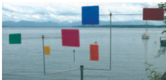
Rosali Schweizer: Mobile Kleine Fiestra

Auch Berufsanfängern, die ALG II in Anspruch nehmen müssen, sollen laut Bundesagentur zunächst auf Grund ihrer gerade erworbenen Qualifikation berufsqualifizierende Maßnahmen angeboten werden. Nutzen Sie diese Möglichkeit!